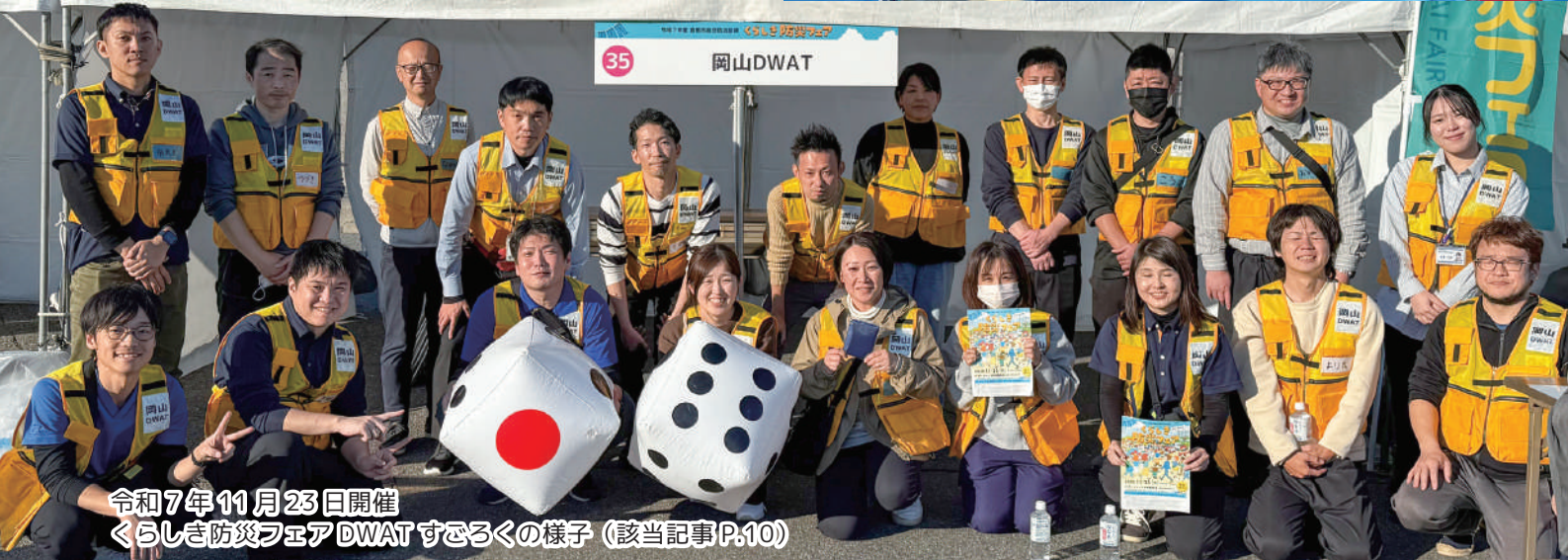
令和7年11月23日開催 暮らし防災フェアDWATすむろくの様子(該当記事P.10)