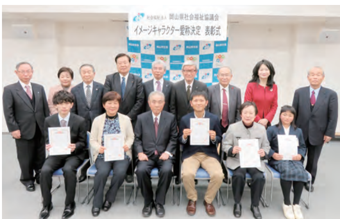
受賞者の皆さまと本会役員にて、記念撮影を行いました。

受賞された皆さま、愛称募集にご応募くださった皆さま、誠にありがとうございました。