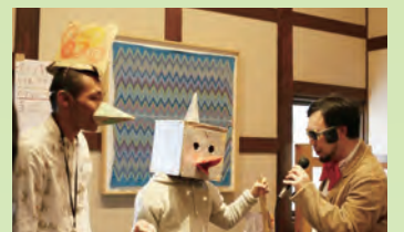
西年にちなんだ鳥人間コンテスト2017

活動はモノづくり『アート』を基に、その人の「よさ」を発信していくことに焦点を当て展開している。モノづくりに関しては「教えない」が基本線だが、「いろいろな素材は提供してみる。そこで何か反応があれば、突き詰めていく感じ。そこから生まれてくるものは本人によって全然違う。どう生まれてくるかをこちらも楽