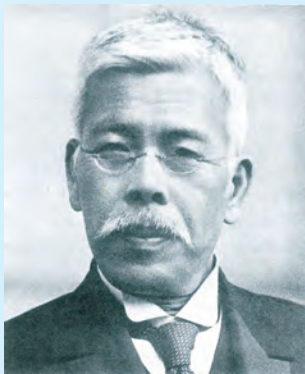
笠井信一元岡山県知事

民生委員制度は、大正6年5月12日、当時の笠井信一県知事のもと岡山県で公布された濟世顧問制度が前身であり、平成29年は、制度創設から100周年を迎えます。