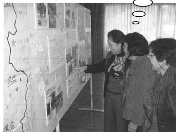
パネル展示で活動をPR！