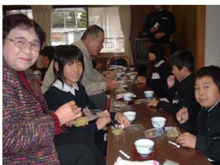
▲手づくりおやつを食べながらおしゃべ