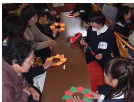
▲写真立てのリースづくり