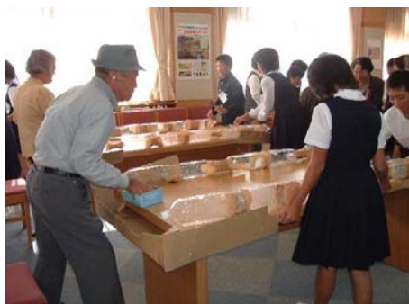
◀ピンポンホッケーを楽しむ様子