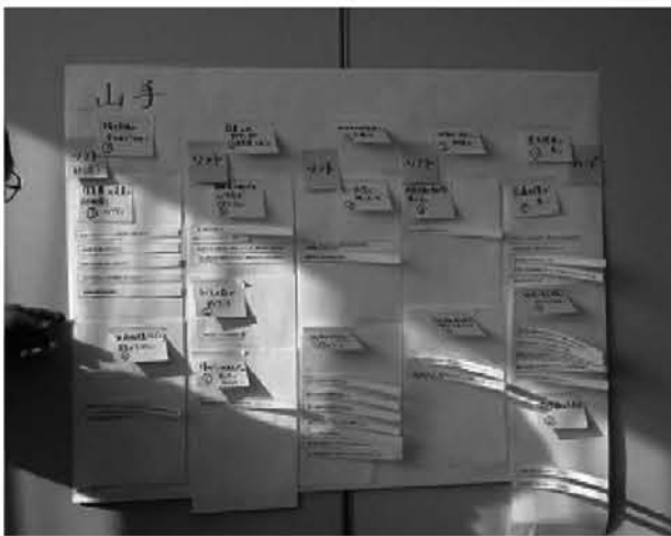
総社市専門研究部会：カードワークにより課題整理

総社市社協は、平成20年度より計画策定に取りかかっており、これまで計3回の策定委員会を開催しました。昨年11月～12月にかけて、市内全14地区で1回目の「福祉のまち