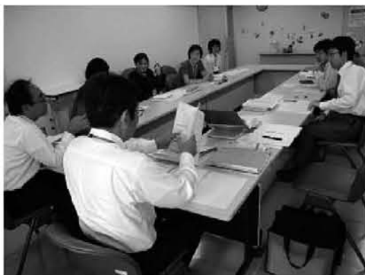
倉敷市：プロジェクトチームでの検討風景

実はここが計画策定において最も困難を極め、かつ重要な通過点であると言えます。策定委員と事務局がうまく連携し、試行錯誤を