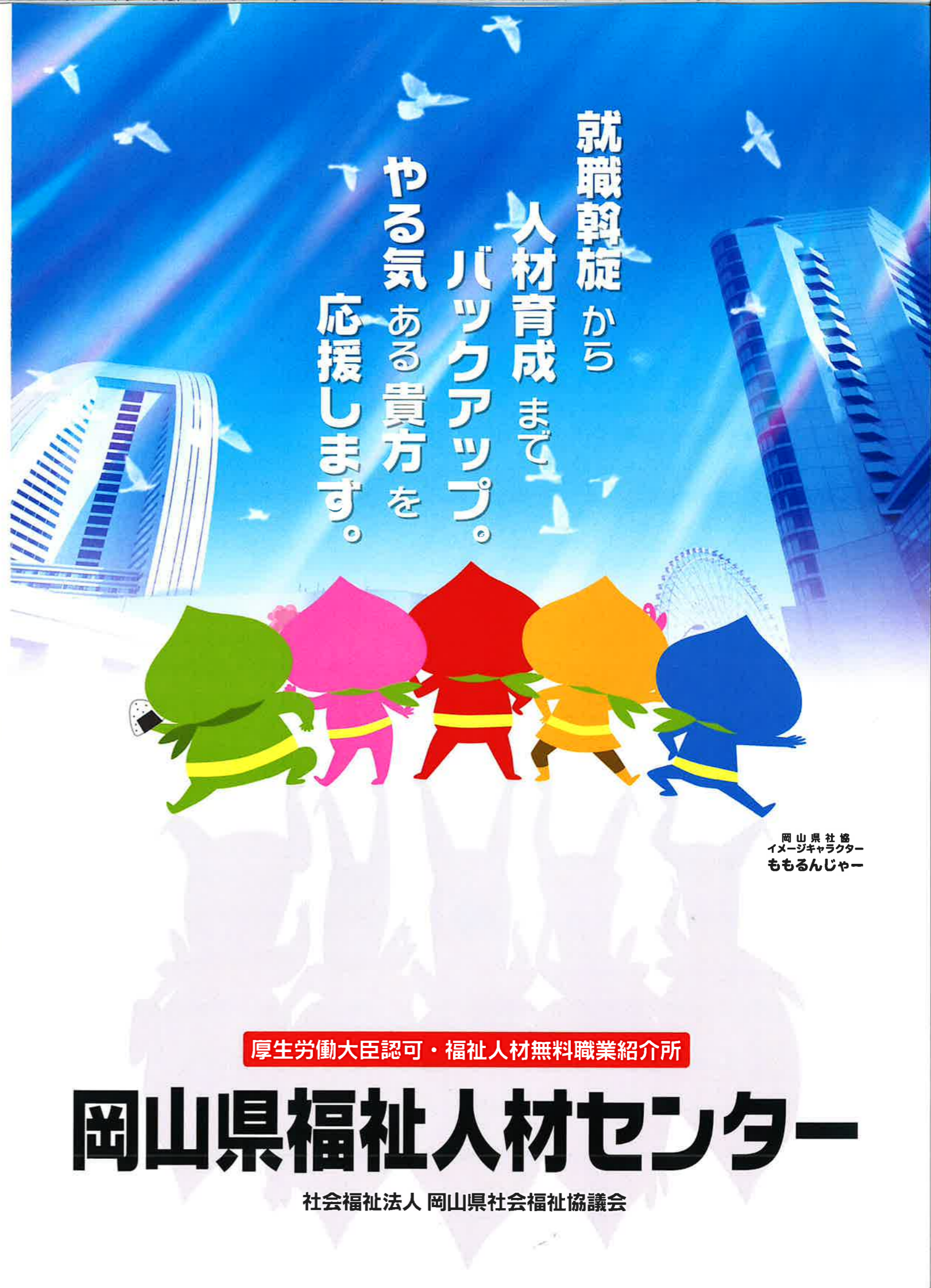
岡山県社協 イメージキャラクター ももるんじゃー