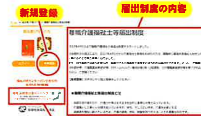
福祉人材センター・パンクー頁