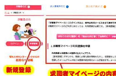
求職者マイページの内容